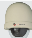
FOCUS SPEED (HD-SDI)