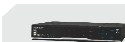
PRESTIGE HD-SDI (08ch HÍBRIDO)

CLIQUE NO PRODUTO E VEJA MAIS INFORMAÇÕES