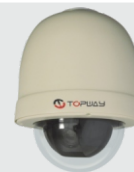
FOCUS SPEED (HD-SDI)